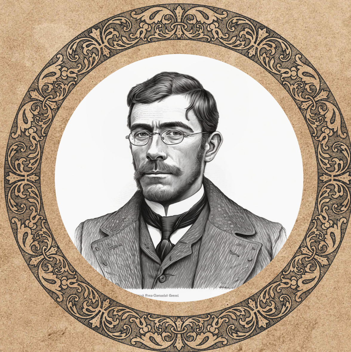
Mr. Caleb Hall Bankdirektör

Som andra offer för den omöjliga mördaren ställer man sig förstås frågan om Mr. Hall och Mr. Rixer på något sätt hade samröre med varandra. Varför valdes just de ut? Ingen har begripit sig på det - ännu.