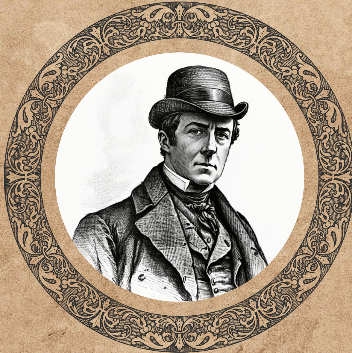
Mr. G. Lestrade Kriminalinspektör

Det är på den stackars Lestrades bord som de båda fallen hamnat. Han önskar verkligen att Watson skriver utförliga rapporter och skickar dem till Holmes. Men kanske är det någon annan som läser dem och löser fallet åt honom?